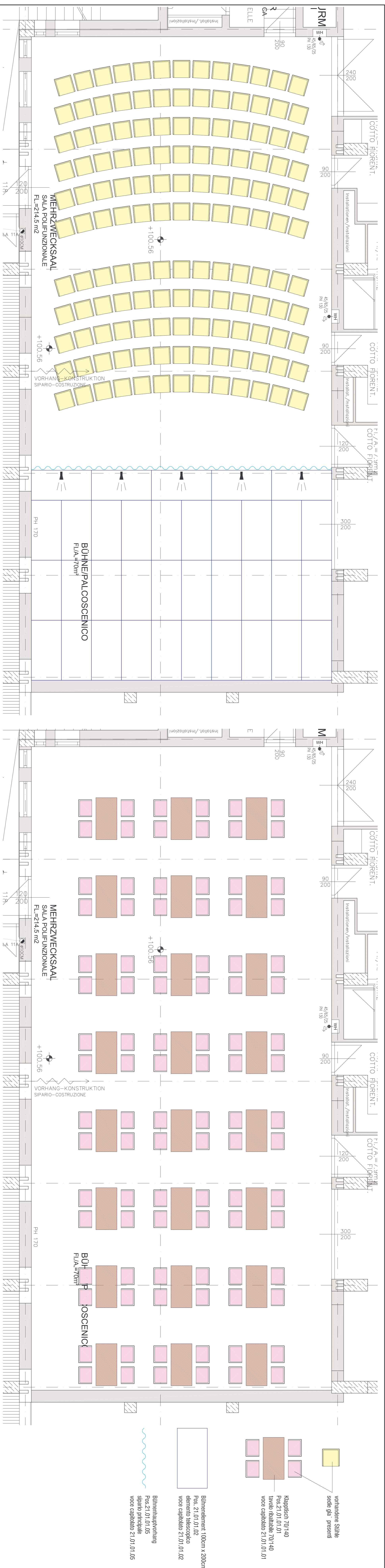
THEATER, VORTRAG 143 Sitzplätze M 1:50 TEATRO, CONFERENZA 143 posti a sedere